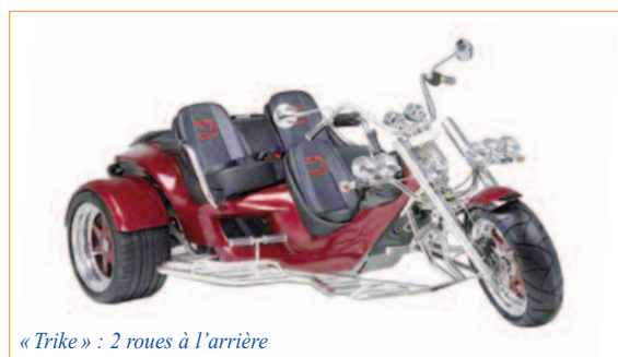
« Trike » : 2 roues à l'arrière