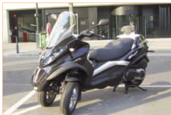
Véhicule utilitaire de type « scooter »