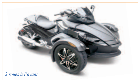
2 roues à l'avant